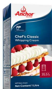
앵커 셰프스 클래식 휘핑크림