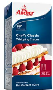
앵커 셰프스 클래식 휘핑크림