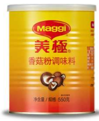
매기 표고버섯 부용