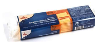
앵커 슬라이스 체다치즈