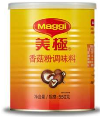
매기 표고버섯 부용