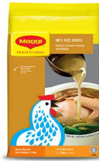
매기 치킨 파우더