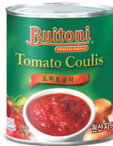
부이토니 토마토 쿨리