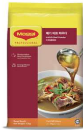
매기 비프 파우더