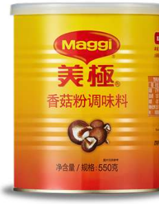
매기 표고버섯 부용