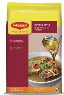
매기 비프 파우더