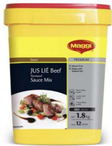
매기 쥐리에 비프 플레이버 믹스