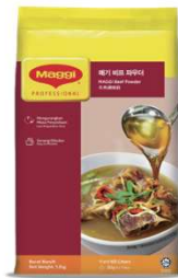
매기 비프 파우더