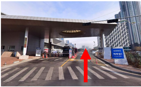
② Hall 3 대회 참가자 출입문 입장